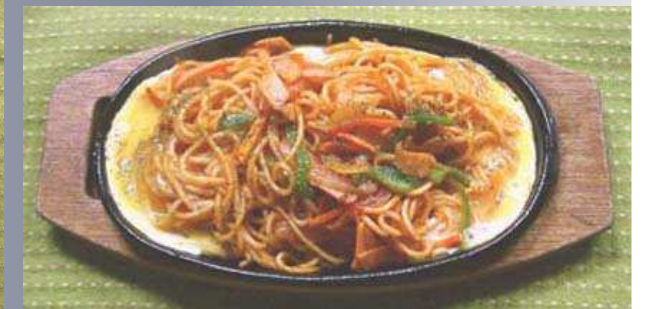
スパゲッティナポリタン