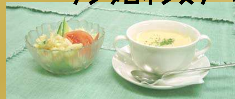
スープミニサラダセット