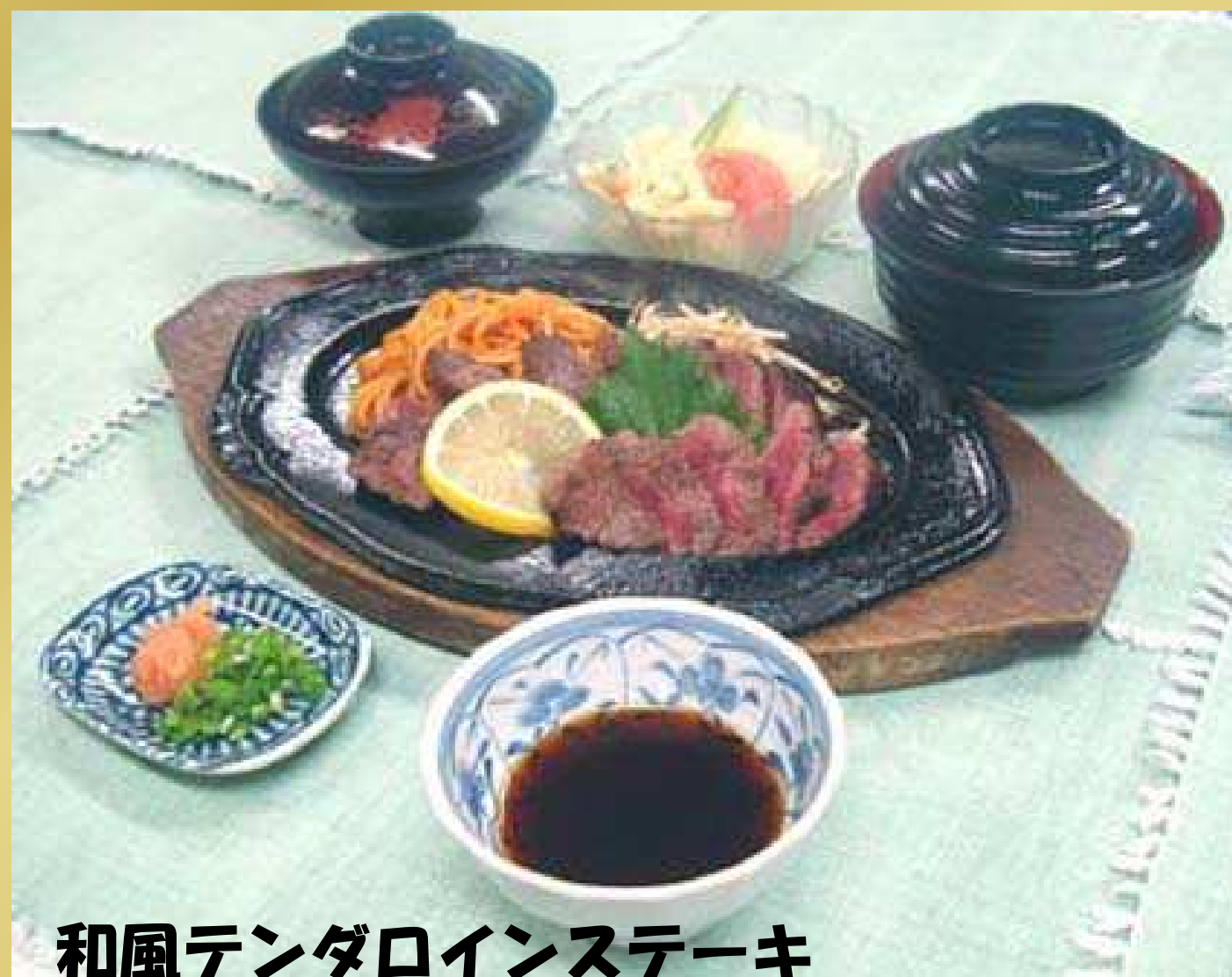
和風テンダロインステーキ