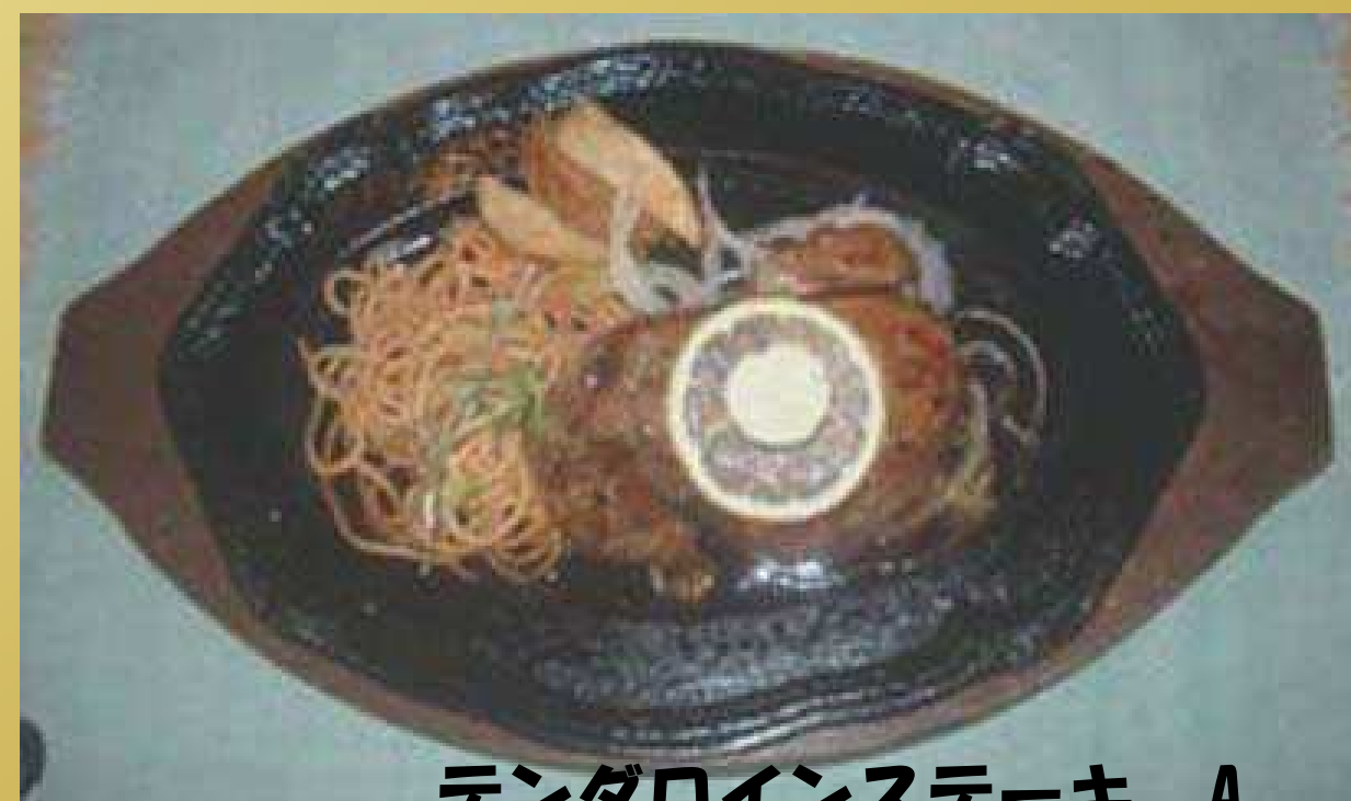
テンダロインステーキ A