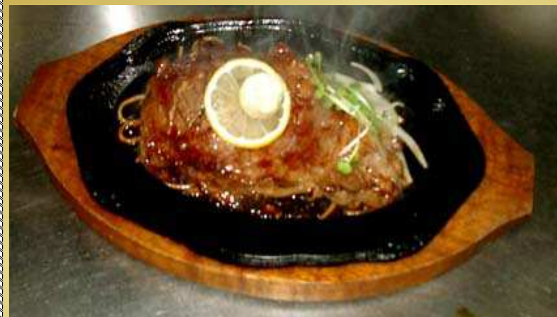
サーロインステーキ A