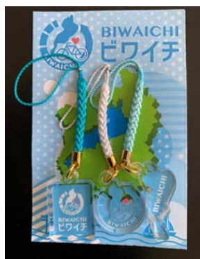
ビワイチストラップ