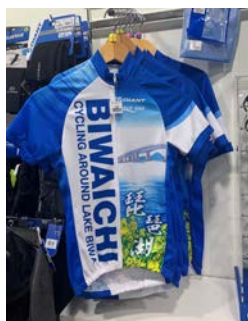
ビワイチジャージ

※ここに紹介したグッズは、ジャイアントストアびわ湖守山、琵琶湖マリオットホテルに置いてあります。