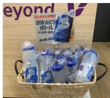
ビワイチサイクルボトル