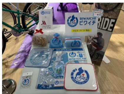
ジャイアントストアびわ湖守山の ビワイチグッズコーナー